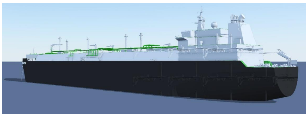
Figura 2 - FSRU GOLAR Tundra (foto e ricostruzione 3D)